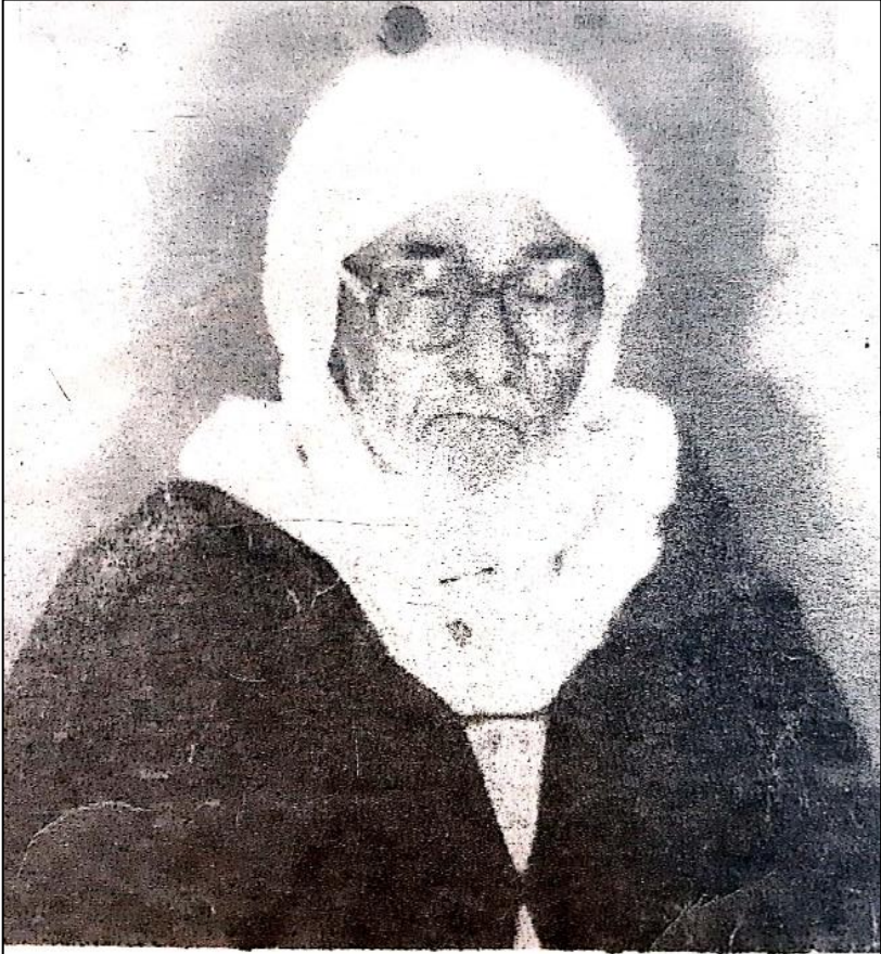
العلامة سي محمد بن سليمان الطيباتي (مرحمه الله)

الملحق 1: صورة للشيخ محمد بن سليمان حمداوي.