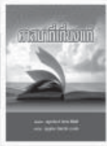
ศาสนาที่เกี่ยวข้อง