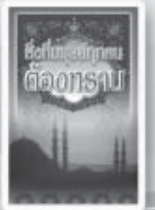
สิ่งที่มนุษย์ทุกคน ต้องทราบ