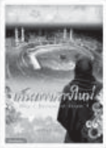
เส้นทางสายใหม่ Why I Believe in Islam