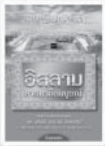
อิสลาม ศาสนาที่สมบูรณ์