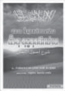
อธิบายพื้นฐาน หลักการศรัทธา ชีริฮ์ อูซูลุสดีนียะฮ์