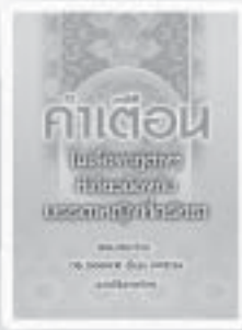
คำเตือนในเรื่องศรัทธา ที่เกี่ยวข้องกับบรรดาเทพ ที่ศรัทธา